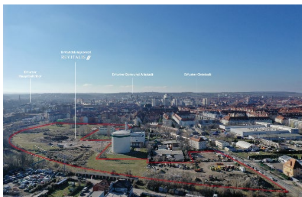
Pressefoto 1 (mit Beschriftung): Luftbild des Entwicklungsareals aus östlicher Perspektive