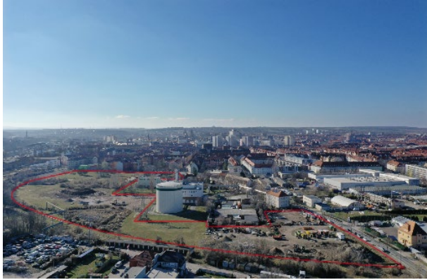
Pressefoto 2 (ohne Beschriftung): Luftbild des Entwicklungsareals aus östlicher Perspektive